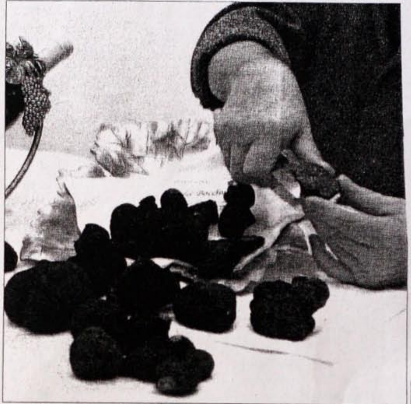
La truffe aime les sols argilo-calcaires de nos terroirs viticoles : Clape, Minervois, Malepère, Cabardès, Corbières.

Une étude de faisabilité, financée par la Région et confiée au cabinet Alcina, devrait permettre de connaître les limites de l'exploita-